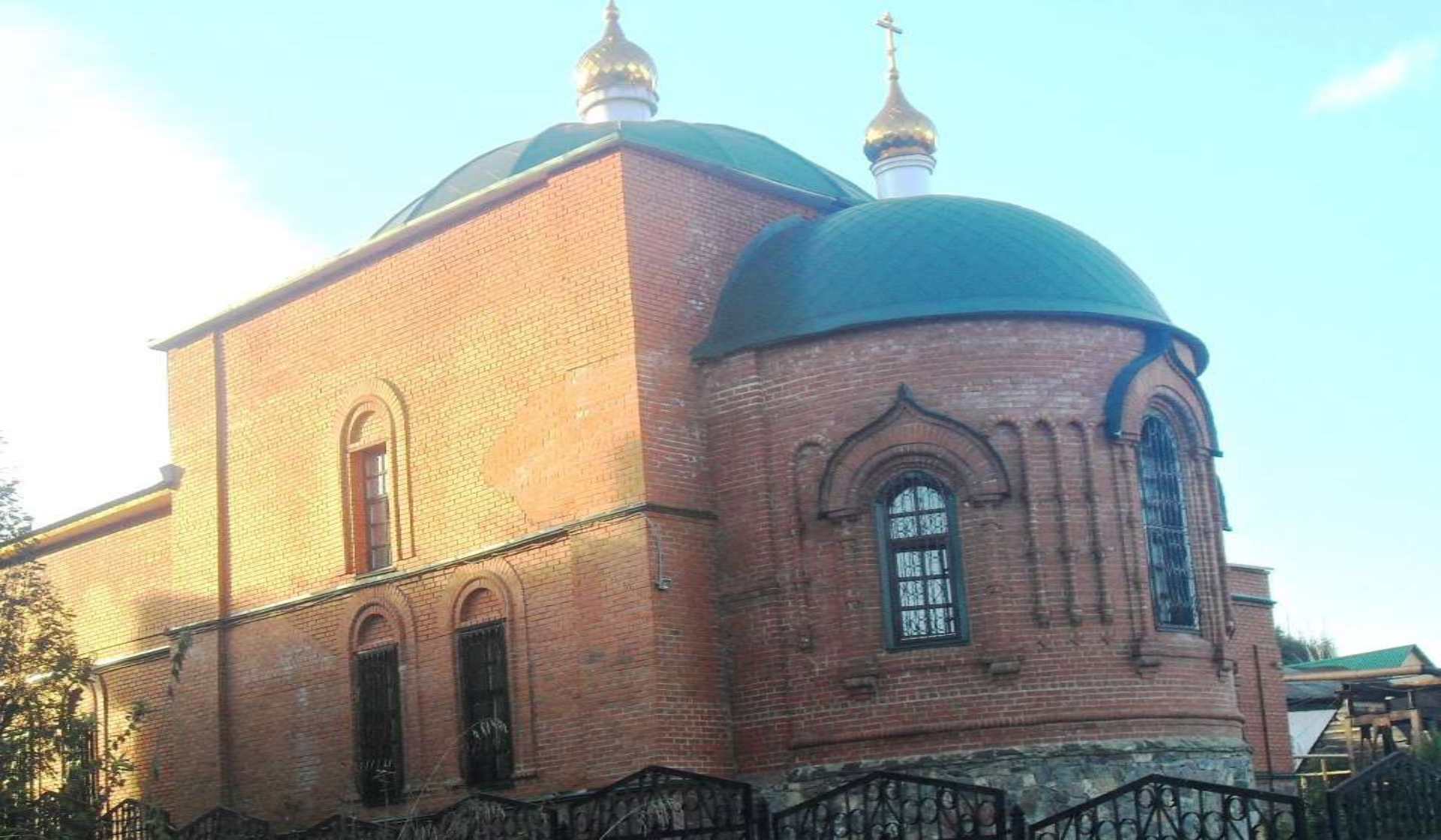
Храм Рождества Христова, г. Усть-Катав