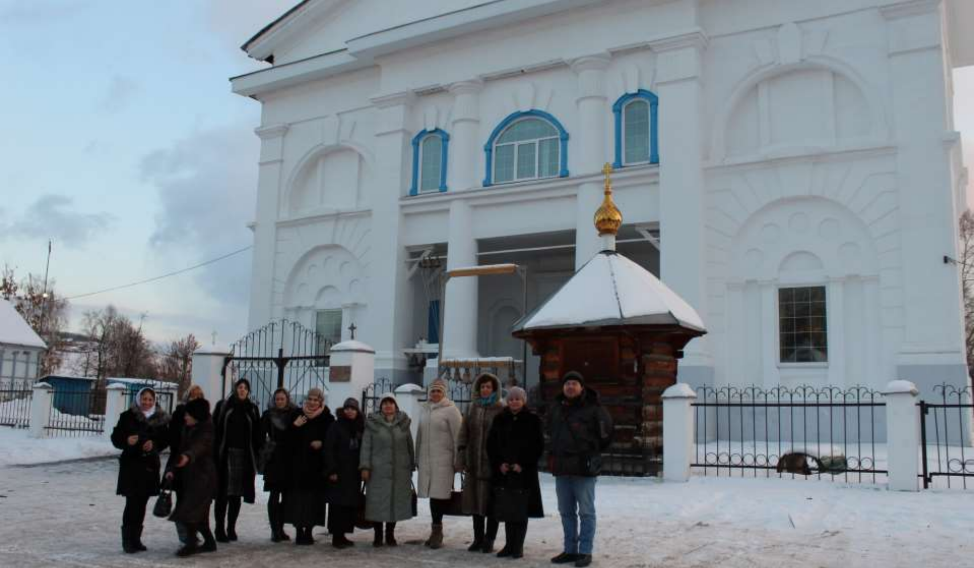
Казанско-Предтеченский храм, г. Катав-Ивановск