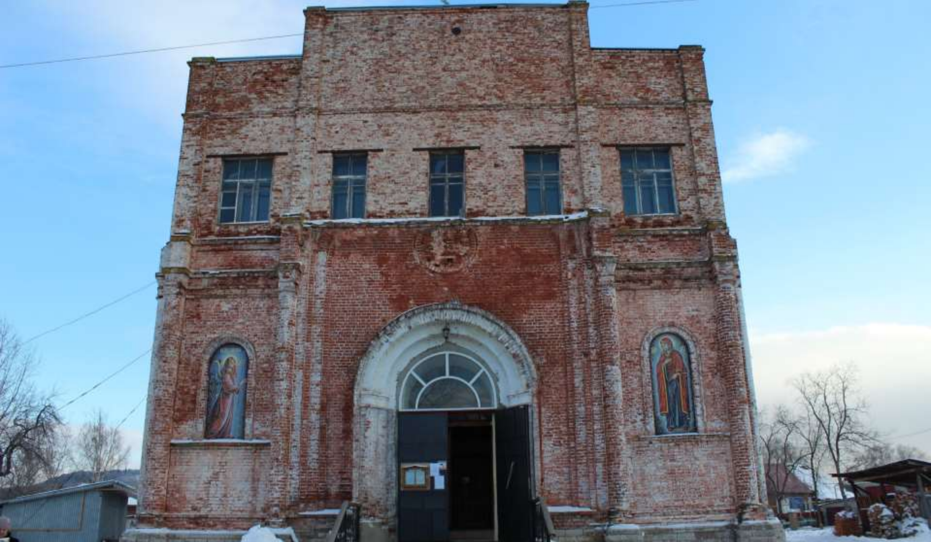
Храм Рождества Христова, г. Юрюзань