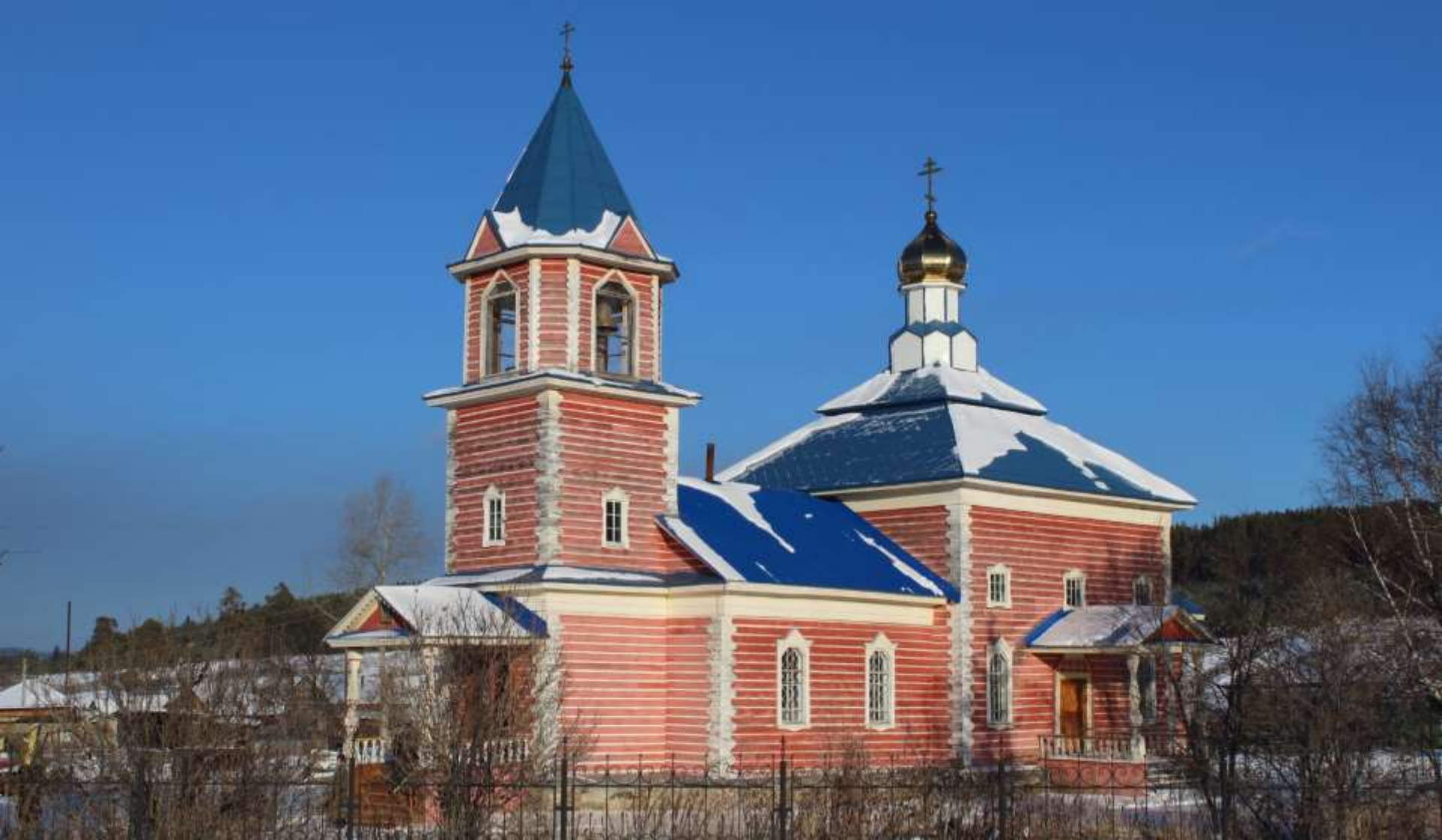
Храм Введения Пресвятой Богородицы, с. Тюлюк