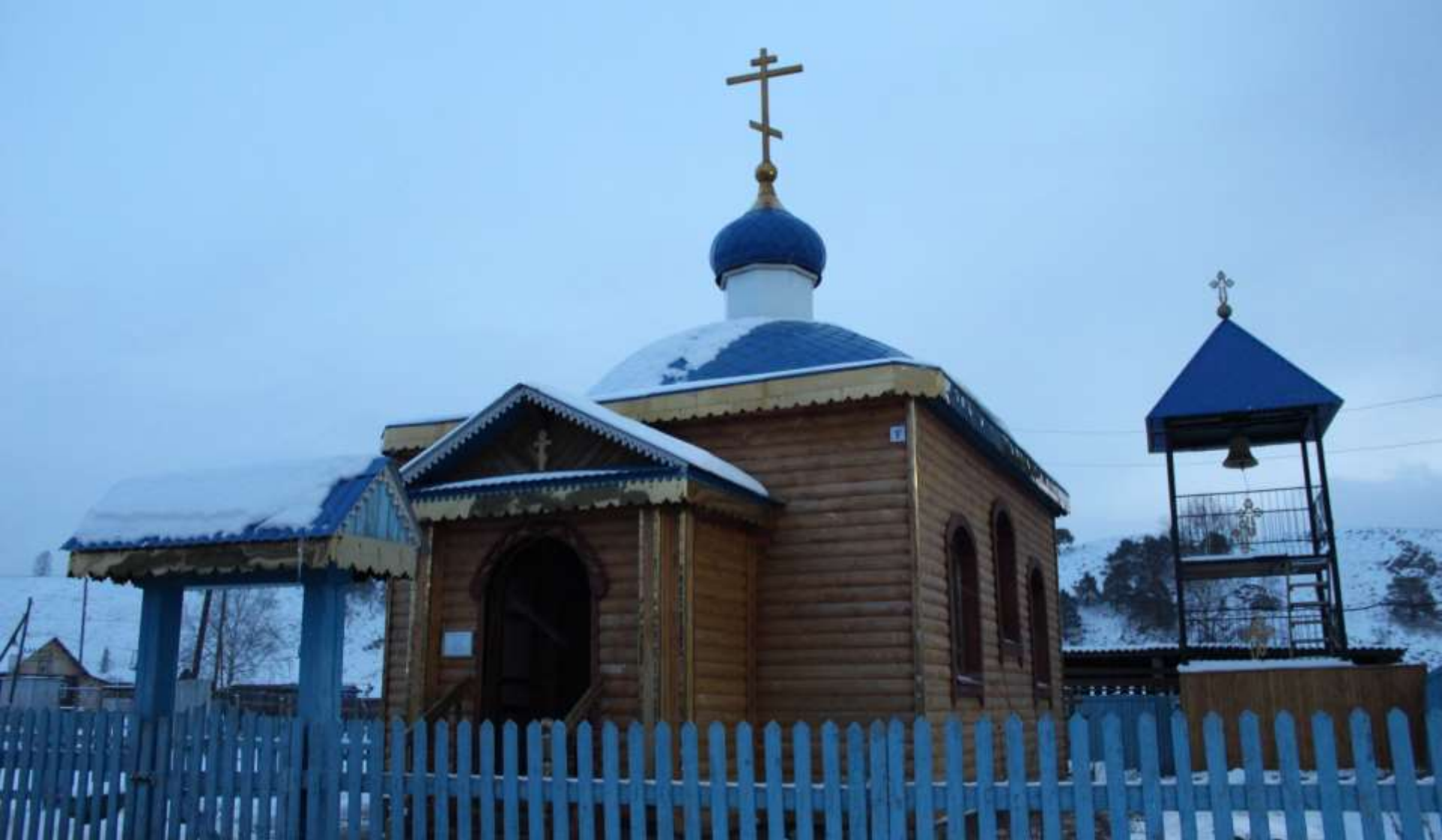
Храм Святого Архистратига Михаила, село Орловка