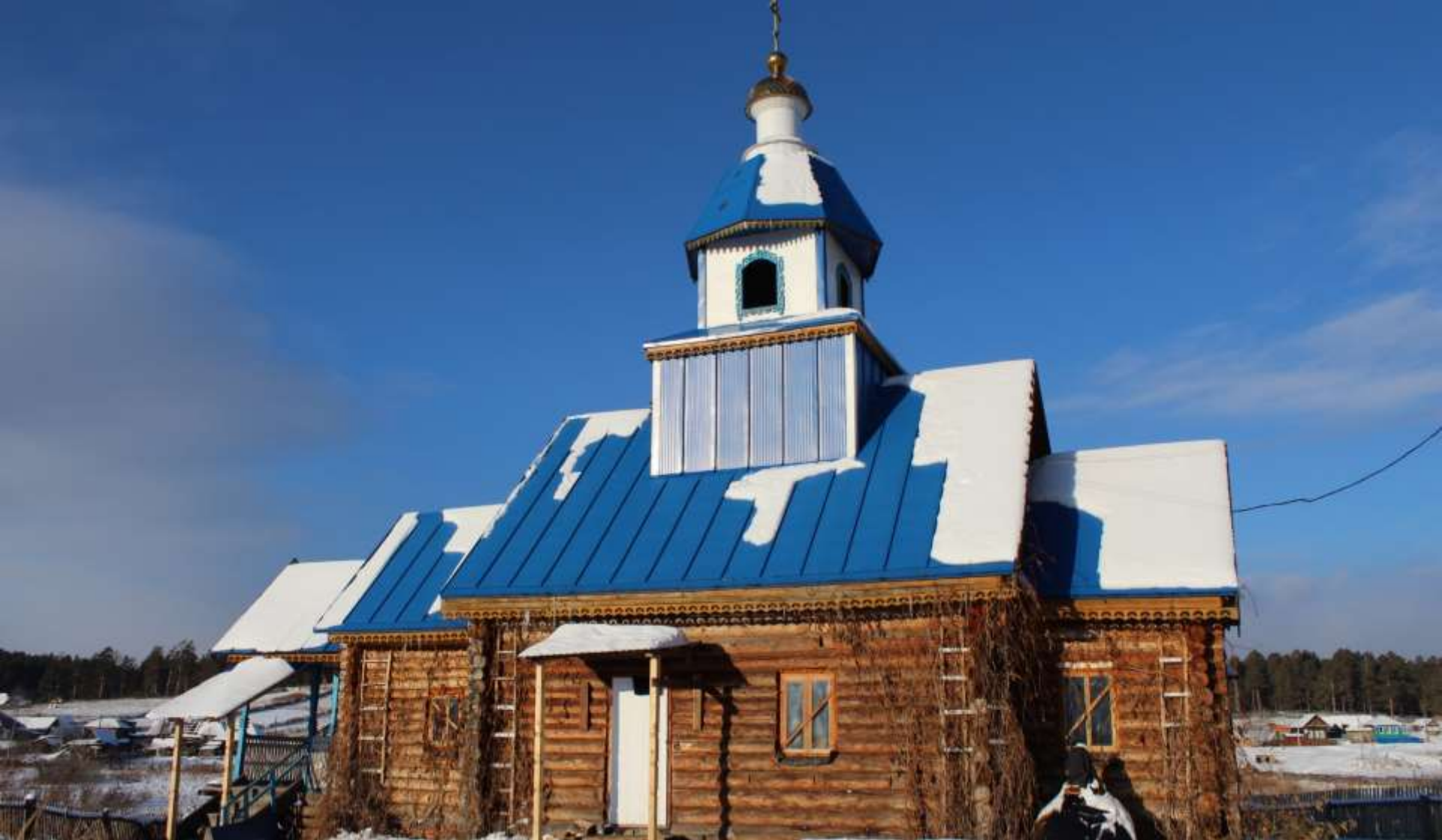
Храм Казанской иконы Божией Матери, с. Меседа