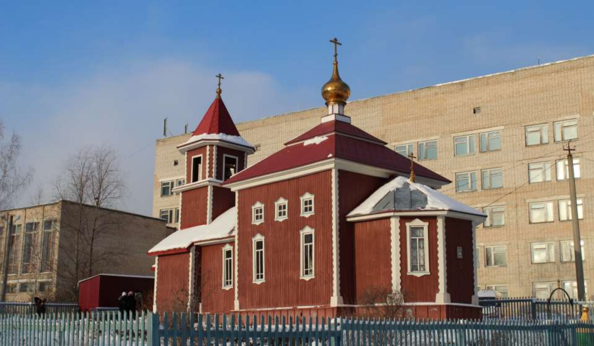
Храм великомученика Пантелеимона Целителя, г. Юрюзань